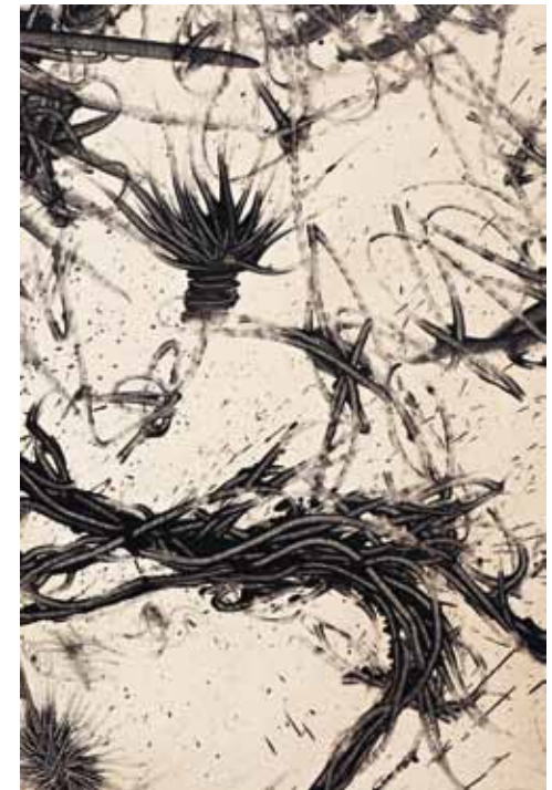
Gras 263 (Ausschnitt), 2011, Öl auf Leinwand, 200 x 150 cm