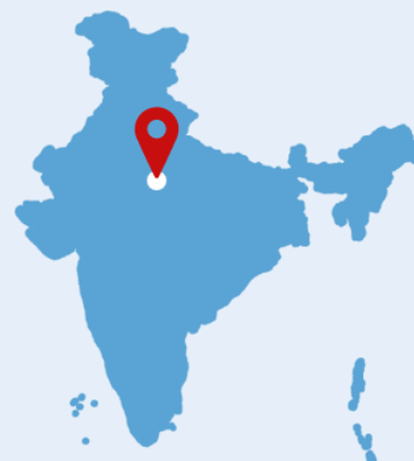
Lage der Stadt Faridabad, Haryana

Disclaimer: Das GIZ-Projekt befindet sich aktuell noch in seiner Startphase. Die Zahlen basieren auf Sekundärliteratur; die tatsächliche Situation kann abweichen und müssen noch durch Vor-Ort-Überprüfung verifiziert werden.