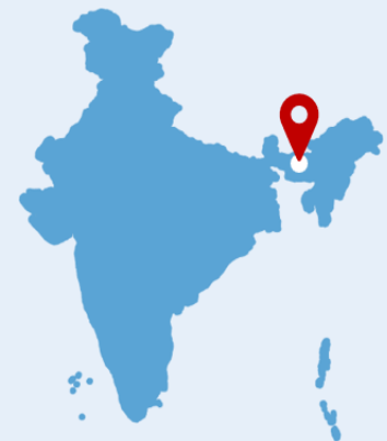
Lage von Guwahati, Assam

Disclaimer: Das GIZ-Projekt befindet sich aktuell noch in seiner Startphase. Die hier erwähnten Zahlen basieren auf Sekundärliteratur; die tatsächliche Situation kann abweichen, und werden in Vor-Ort-Überprüfungen vom Projekt noch verifiziert.